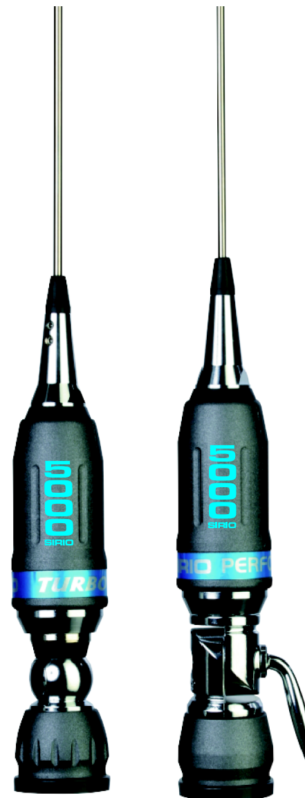
TURBO 5000 PERFORMER 5000